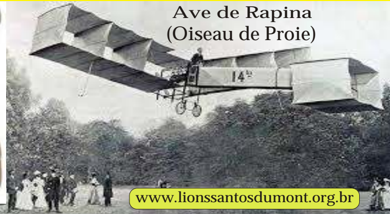
Ave de Rapina (Oiseau de Proie)

Edital Utilidade Pública Federal: Lei 5575, de 17/12/69 Estadual Dec. 72300 De 25/05/72