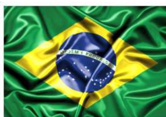
REPÚBLICA FEDERATIVA DO BRASIL

Símbolo nacional comemorado no dia 19 de novembro, data de sua criação. Comemorada nos quatro cantos do país, em prosa, verso e manifestações cívicas